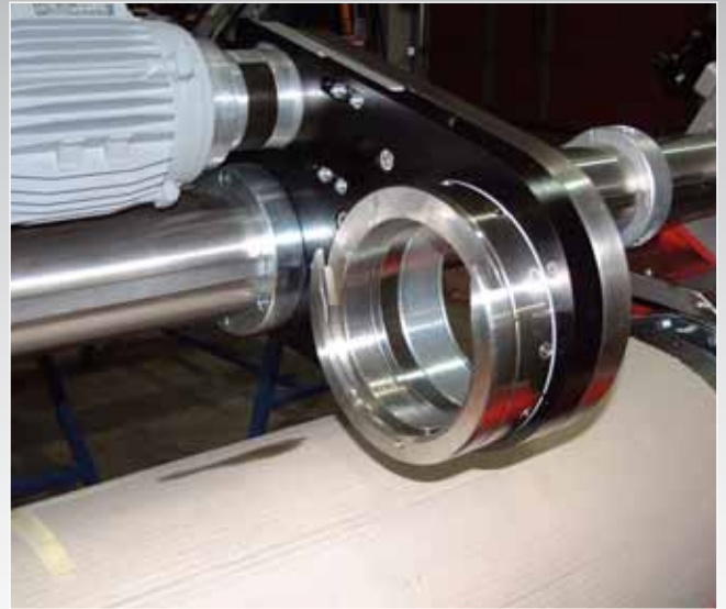
VARIOPRINT-Druckstation für alle gängigen Rapporte. V-max 100 m/min. VARIOPRINT- printing station for all standard repeats. V. max. 100 m/min

Variable control of application-amount and alteration of working width without change of the Dosingroll at running machine! This coating machine is a further development of the Magnetroll-Technology existing already decades. It guarantees even application over wide working widths, works reliable and is economical due its variability.