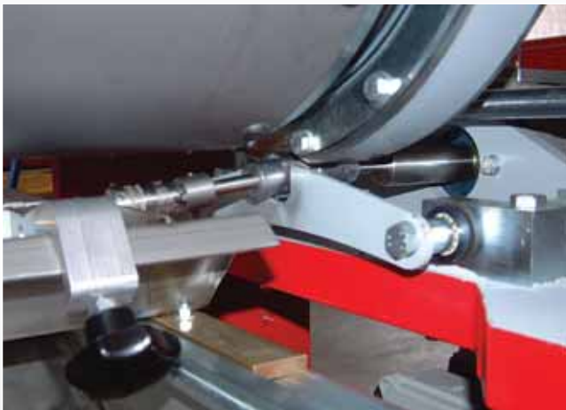
Überlaufwanne mit wenig Inhalt -5L/lfm. Variabler Dosierrollenantrieb. Overflow tray with small content - 5L/rm Variable drive of the Dosingroll.